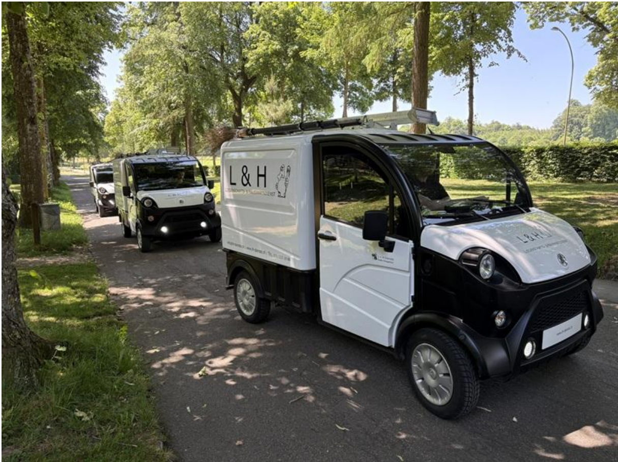
Bild: Aixam Professional sind auch gute Werbeträger und finden immer einen Parkplatz.

Was anfangs von Mitbewerbern noch kritisch beäugt wurde, hat sich inzwischen als durchdachtes und zukunftsfähiges Konzept bewährt. Heute ist klar: Wer im städtischen Raum effizient arbeiten will, sollte seinen Fuhrpark neu denken.