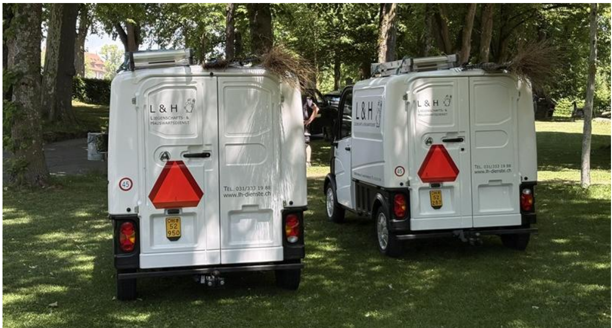
Bild: Aixam Professional können mit dem Fahrausweis Kategorie F gefahren werden.

Die Erfahrungen von L&H zeigen deutlich, dass kompakte Elektro-Nutzfahrzeuge gerade im urbanen Umfeld eine überzeugende Alternative zu klassischen Lieferwagen darstellen. Insbesondere für Unternehmen mit vielen kurzen Fahrten, häufigen Stopps und begrenztem Platzangebot bieten sie klare Vorteile – sowohl wirtschaftlich als auch operativ.