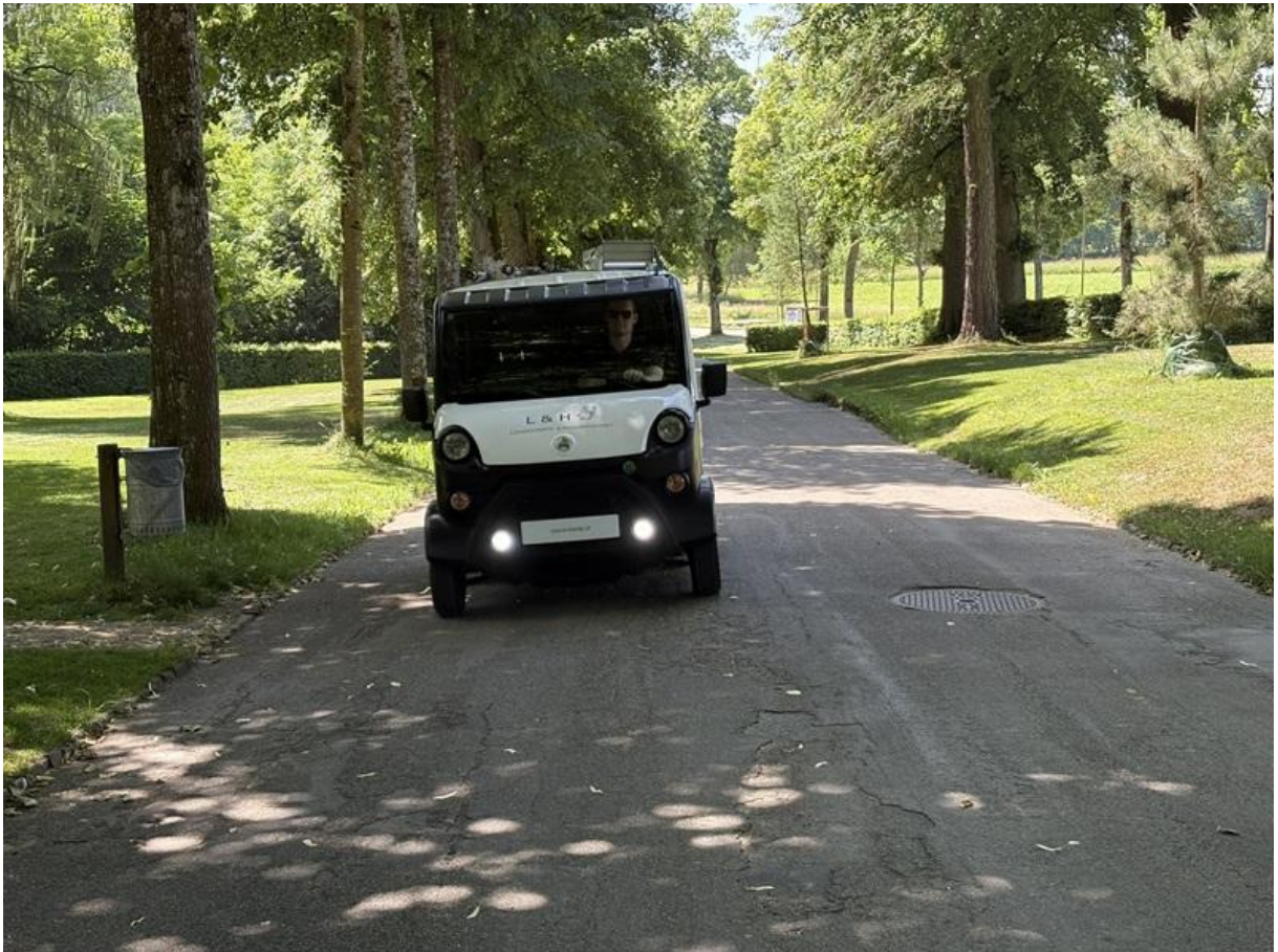
Bild: Keine Strasse und kein Weg ist zu klein.