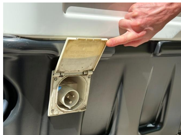
Bild (v.l.n.r.): In Zusammenarbeit mit Sortimo, wird der Aixam Professional zum Raumwunder. Die eTrucks können mit 230 V geladen werden.